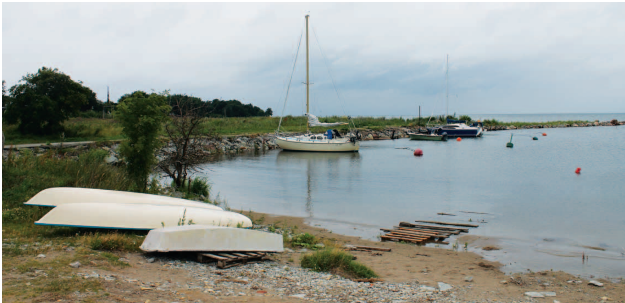
Neeme sadamas saab hoida väiksemaid aluseid. Külaelanike sõnul on sadam üldiselt siiski nukras seisus ning vajaks süvendamist ning väljaarendamist.