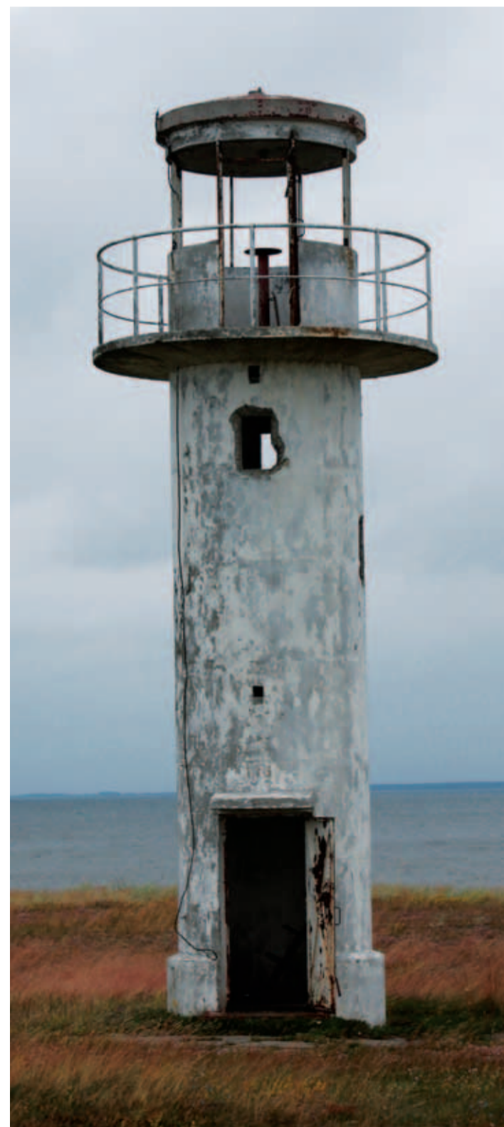
1938. aastal valminud Ihasalu (ka Neeme) tuletorn, mis on saanud küla üheks sümboliks.