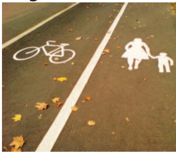
Jõelähtme vallas on valminud mitu uut kergliiklusteed.

Kahjuks mõjus ülemaailmne majandussurutis sedasi, et Eesti teedeehituse toetusrahad jõudsid kohale alles aastal 2009 ning märtsis 2010 sai AS Merko Ehi-