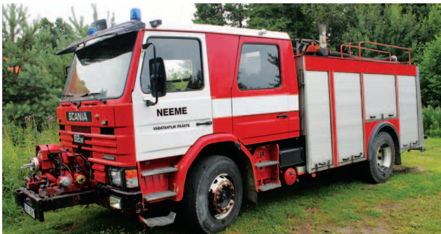
Neeme külas tegutseva vabatahtliku päästekomando masinad seisavad lageda taeva all, talveks oleks aga hädasti vaja masinad sooja ruumi saada.